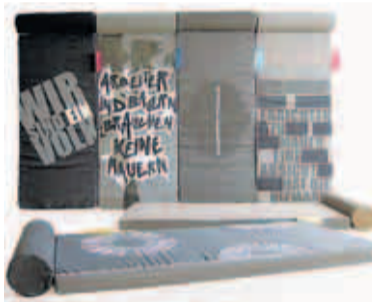
Raumteiler oder Sitzmöbel – die Mauer- matratzen werden in London gezeigt

Mauerthema interpretiert. Die drei Designerinnen haben Mauer- matratzen entwickelt, die hängend als Raumteiler und liegend als Sitzmöbel fungieren können. Zitate wie „Wir sind ein Volk“ sollen zur Auseinandersetzung mit der Geschichte herausfordern. Doch wie sehen die Designer die kommenden zwei